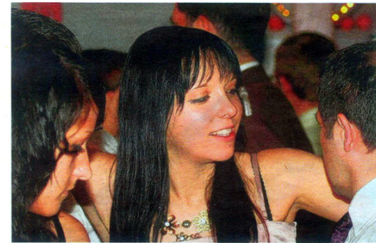
Ein kleiner Flirt ist bei einem Faschingsball fast Pflicht.