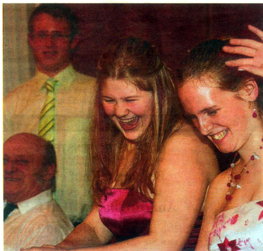
Die Familie Heindl brachte heuer erstmals die „Schwiegertochter in spe“ (Mitte) mit zum Feuerwehrball.