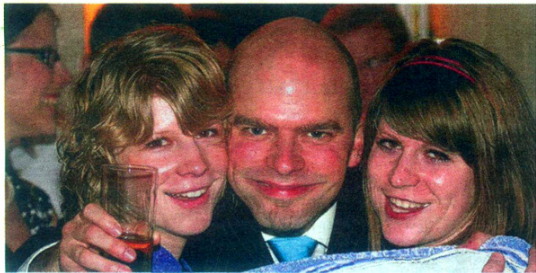
Bei ihm hat die gute Laune nichts mit dem Glas in der Hand zu tun - er ist immer „gut drauf“ und ganz besonders, wenn ihn fesche Mädels umrahmen.